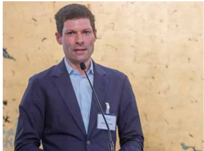
Der Jurist, Autor und Journalist der Süddeutschen Zeitung, Ronen Steinke, über die Ermittlungsverfahren im Rahmen des Hamas-Überfalls am 7. Oktober 2023 vor dem ICC.

On the other hand, was there an intention behind the prevention of the introduction of humanitarian aid at the beginning of the war by Israel to starve and cause suffering to the non-involved Palestinian people? This question should be examined by the Criminal Court in Hague,