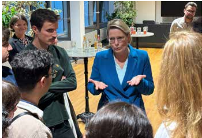
Bundesministerin der Justiz und für Verbraucherschutz, Dr. Stefanie Hubig, empfing die jungen Gäste aus Israel und Deutschland in Ihrem Ministerium.

The Ministry of Justice relocated to the building in 1999, adding a fifth executive floor and a rooftop. Today, the historic courtyard serves as a venue for receptions and official ceremonies. A second courtyard features a cen-