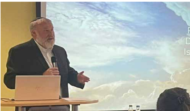
Gewaltenteilung im israelischen Rechtssystem: Spannender Vortrag von Prof. Dr. Avichai Mandelblit, Generalstaatsanwalt a.D.

Prof. Mandelblit's lecture offered a comprehensive exploration of the unique aspects of the separation of powers in Israel, with a particular focus on the crucial role played by the Attorney General and the intricate challenges inherent in maintaining a delicate balance between the executive and legal branches. Throughout the lecture, the speaker provided valuable insights into the multifaceted significance of the Attorney General as both a gatekeeper and a public legal advisor, entrusted with the vital task of ensuring government actions adhere to the law.