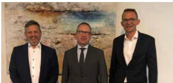
Minister Benjamin Limbach (M.) flankiert von den DIJV-Vorsitzenden Zvi Tiroch (l.) und Elmar Esser.

Auf Einladung des Justizministers von Nordrhein-Westfa-