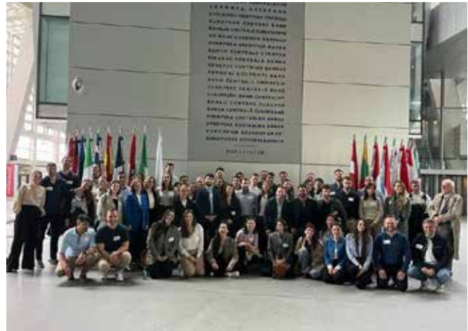
Gruppenausflug: Besuch der Europäischen Zentralbank in Frankfurt/M

In order to maintain price stability, the ECB steers financing conditions to ultimately influence price developments, usually through key policy rates. When official interest rates are no longer effective, the ECB uses alternative instruments to influence financial conditions. Such measures can be applied to complement policy rate actions when policy transmission is impaired, for example by increasing fragmentation risk. Additionally, these measures can be applied to add to policy rate action when policy stance is impaired, for example when policy rates are hitting rock bottom.