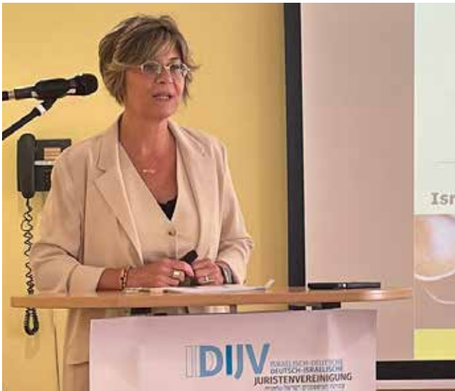
Klimawandel als globale Herausforderung; Dr. Tzipi Itsiq über die Situation in Israel

in Israel. The first case involves a lawsuit against the Israel Electric Corporation for its use of fossil fuels and alleged contribution to climate change. The second case is a class action lawsuit against Israel Chemicals for eco-