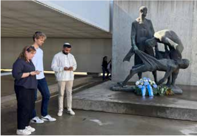
Kranzniederlegung und Kaddisch: Bewegende Momente in Sachsenhausen.

Standing on the wide roll-call square, we learned how prisoners were forced to assemble for hours each day regardless of weather, counted and punished for the smallest deviations. All of the above reflected human endurance while emphasizing how discipline, humiliation, and exhaustion were central mechanisms of control.