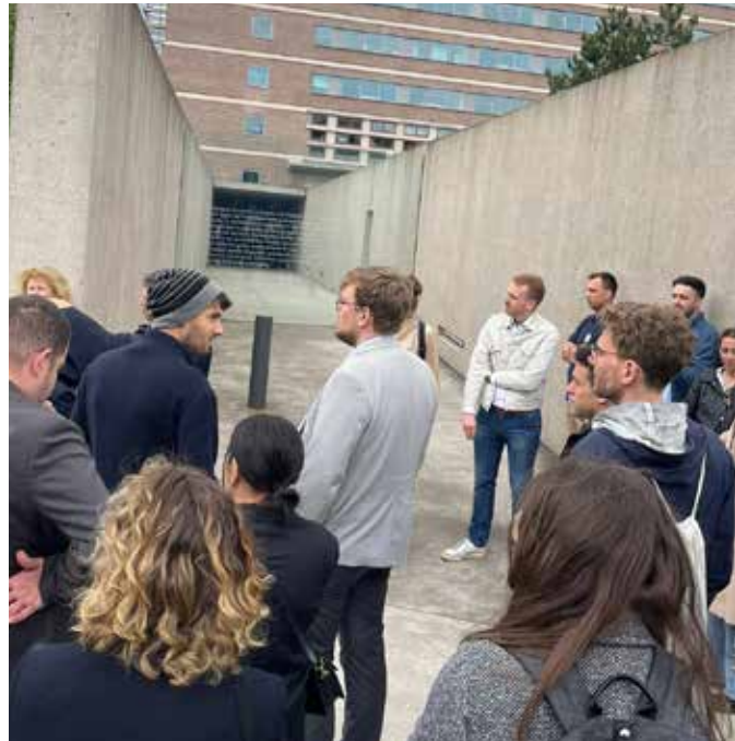
Auf dem Weg in die Großmarkthalle: Die Gruppe besucht die Halle unter der EZB, in der die Gestapo während des Krieges die jüdische Bevölkerung versammelt hat.

Up to 1.000 people at once were asked to arrive at the Großmarkthalle on Sunday mornings and had to get there by foot, since the use of public transportation had been forbidden for Jews by the Nazis. The families