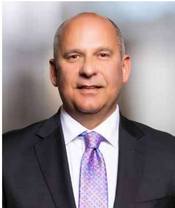
Prof. Dr. Roman Poseck, DIJV-Vorstandsmitglied und Hessischer Minister des Inneren, für Sicherheit und Heimatschutz.

Trotz dieser schwierigen Zeit gab es auch Lichtblicke, zu denen ich insbesondere die DIJV-Jugendtagungen im Mai 2023 in Frankfurt sowie im September 2025 in Berlin und Brandenburg zähle. Hierbei wurde nicht nur jeweils ein hochspannendes inhaltliches Programm für die Nachwuchsjuristen geboten, sondern es gab auch zahlreiche Gelegenheiten beim fantastischen Rahmenprogramm, um das Fundament für die tiefe deutsch-israelische Freundschaft zu festigen. Ein be-